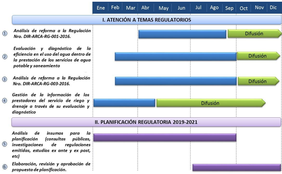
ILUSTRACIÓN 2 CRONOGRAMA DE ACTIVIDADES DE LA AGENDA REGULATORIA 2018

En la ilustración siguiente se presenta el cronograma de actividades a desarrollarse dentro de la Agenda Regulatoria 2018: