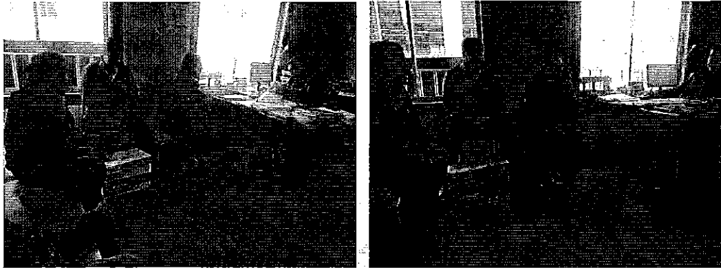
Fotografía 3. Desarrollo de la reunión de trabajo

✓ Reunión de trabajo con el Responsable Técnico del Centro de Atención al Ciudadano del Cañar, para la difusión de la Normativa Regulatoria Nro. DIR-ARCA-RG-009-2018 a los representantes de los prestadores comunitarios del servicio de riego y drenaje de la provincia del Cañar.