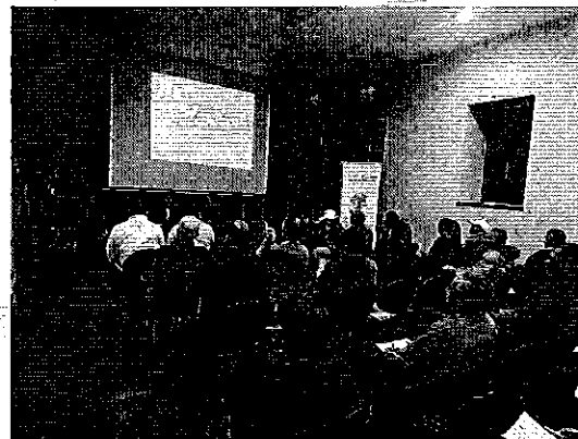
Fotografía 1. Desarrollo del taller