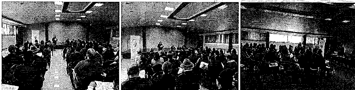
Fotografía 2. Desarrollo del taller.