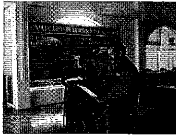
Fotografía 1. Visita a la Junta riego de la acequia Mocha