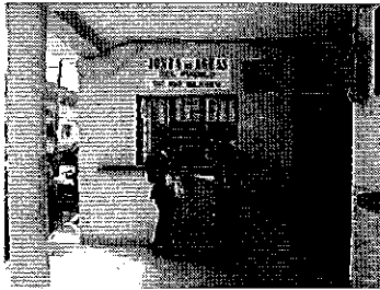
Fotografía 2. Visita a la Junta de Aguas del Pueblo de Río Blanco