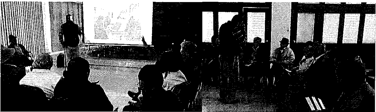
Fotografía 3. Reunión con representantes de las juntas de riego de la provincia de Cotopaxi.