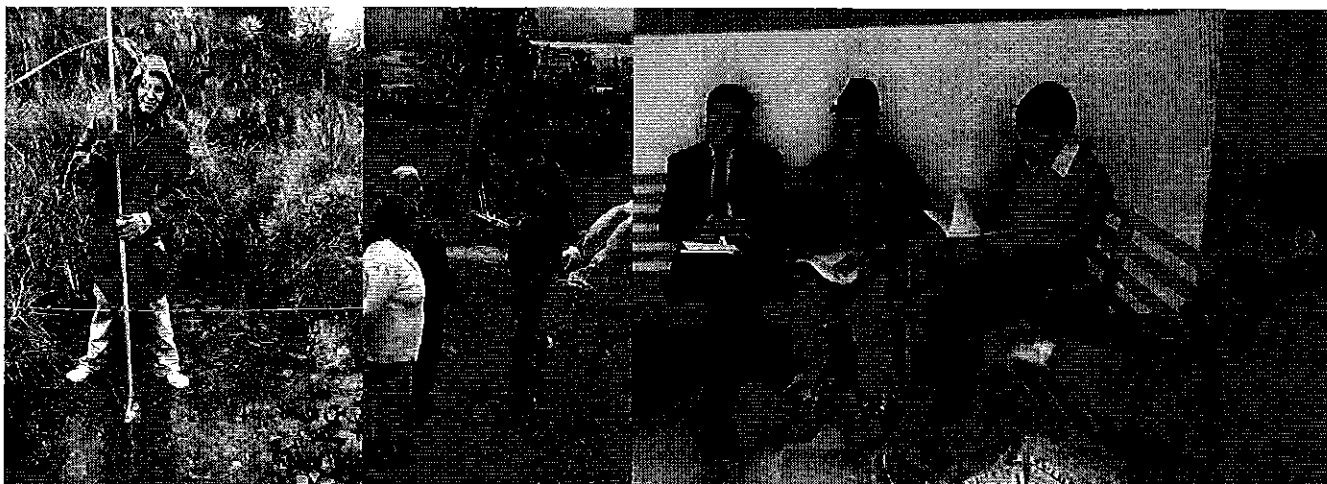
Fotografía 2. Visita, recorrido, aforamiento a la Cooperativa Agropecuaria Carchi.