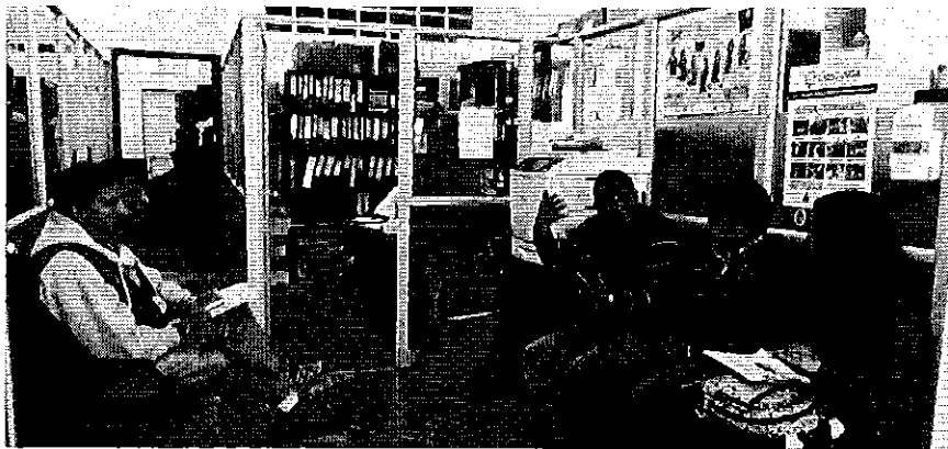
Fotografía 4. Reunión con el Director de Riego y Drenaje del GAD Provincial de Cotopaxi.