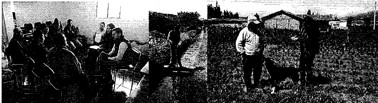
Fotografía 5. Visita, recorrido, aforamiento en el Directorio de Aguas Jesús del Gran Poder.