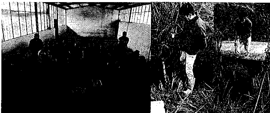
Fotografía 1. Visita, recorrido, aforamiento a la Acequia San Vicente de Pusir – Yascón.