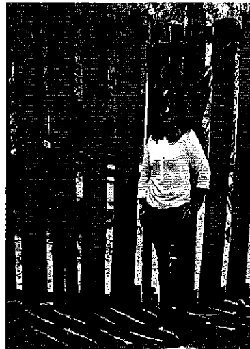
Foto: ubicación posible usuario concesión de agua para piscícola