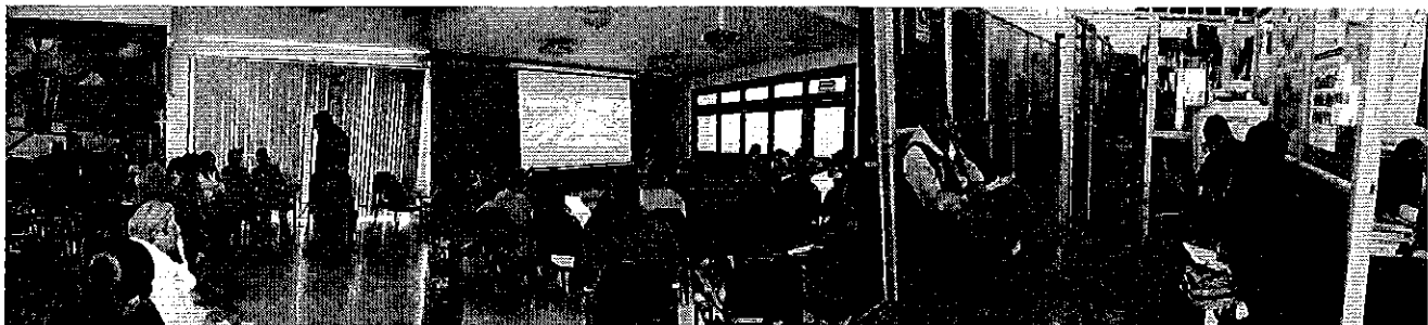
Foto 1. Reunión de trabajo con representantes de las Juntas de Riego y con Director de Riego y Drenaje del GAD provincial de Cotopaxi.