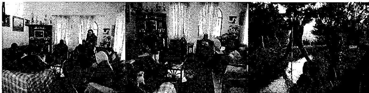
Foto 3. Reunión de trabajo con el Directorio de la Junta de Aguas Hacienda SAN FRANCISCO para llenado de Ficha Técnica de Investigación y encuestas, recorrido por el sistema de riego, aforamiento del mismo.