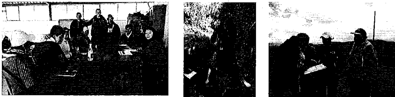
Fotografía 3. Visita, recorrido, aforamiento al Directorio de Aguas Comuna El Galpón.