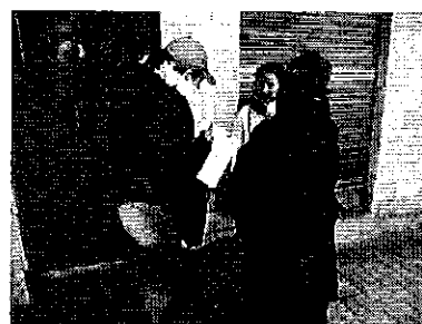
Fotografía 4. Visita, recorrido, aforamiento en el Directorio de Aguas Bartolomé Sancho Hacho Pullopaxi