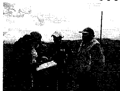
Fotografía 3. Visita, recorrido, aforamiento al Directorio de Aguas Comuna El Galpón.