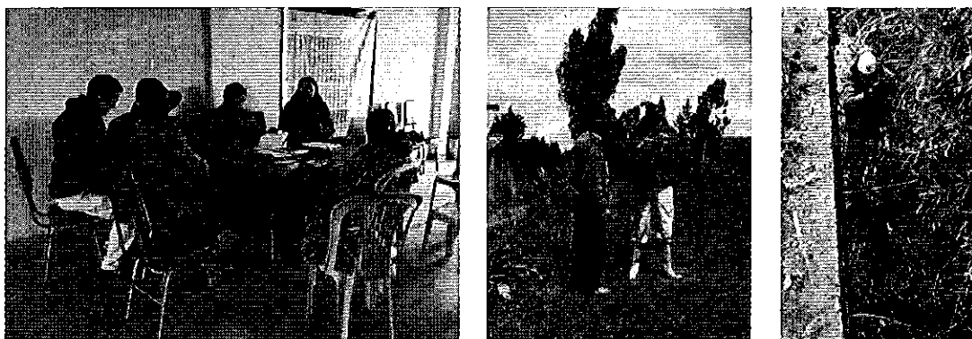
Fotografía 2. Visita, recorrido, aforamiento a la Directorio de Aguas Canal Central Toacaso.