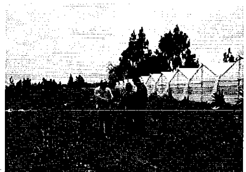
Fotografía 1. Visita, recorrido, aforamiento al Canal Jiménez Cevallos.