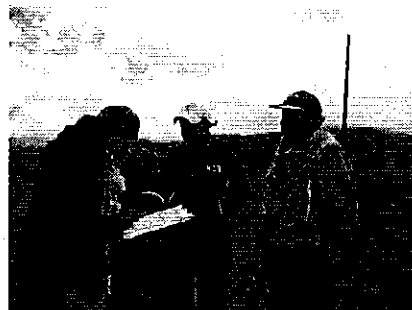
Fotografía 2. Visita, recorrido, aforamiento al Directorio de Aguas Comuna El Galpón.