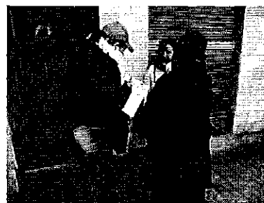
Fotografía 3. Visita, recorrido, aforamiento en el Directorio de Aguas Bartolomé Sancho Hacho Pullopaxi