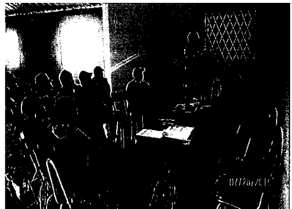
Profesionales equipos técnico de control de riego- en reunión con los directivos de la Junta de Riego acequia Mocha-Quero-Peliléo