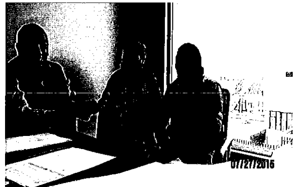
Profesionales Equipos Técnico de control de riego- en reunión con la Responsable Técnica de la Demarcación Hidrográfica de Mira (Tulcán).