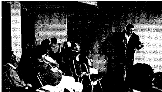
Fotografía 2. Reunión con los representantes del Directorio de Aguas de la Acequia Casimiro Pazmiño.