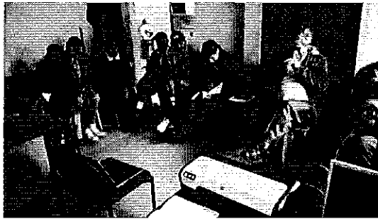
Fotografía 1. Reunión con los representantes del Directorio de Aguas de la Acequia Alajua Tifulum Jauregui