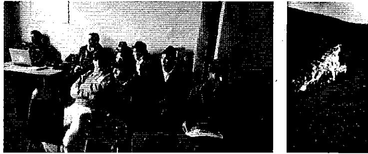
Fotografía 3. Reunión con los representantes del Directorio de Aguas de la Acequia Casimiro Pazmiño e inspección de la captación