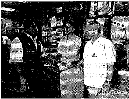
Fotografía 2. Contactos con representantes de Juntas de riego, con apoyo del Técnico de la DH Mira