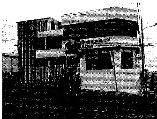
Fotografía 3. Visita a la DH Mira - CAC Tulcán