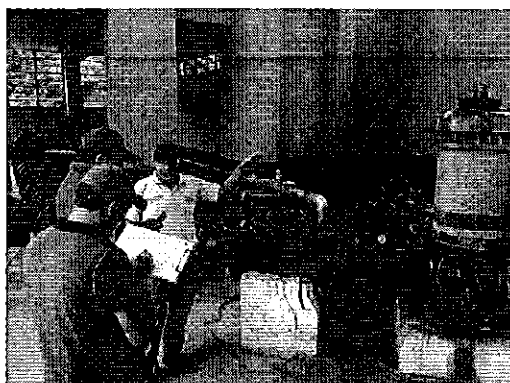
Ilustración 1. Cárcamo de bombeo desde la captación a Planta de Potabilización, Estación 1.