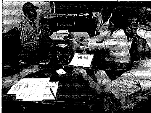
Ilustración 3. Reunión con los funcionarios de SENAGUA en las oficinas de la EPMAPAPL.