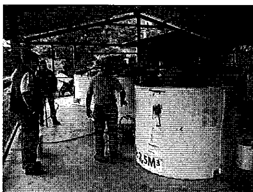
Ilustración 2. Planta de Tratamiento de Aguas Residuales de la EPMAPARS-P.