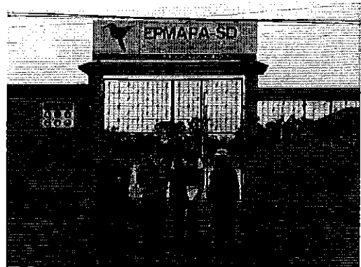
Ilustración 6. Planta de Tratamiento de Agua Potable de la EPMAPA-SD.