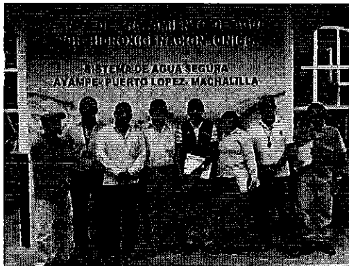
Ilustración 4. Equipo de trabajo: ARCA-SENAGUA-EPMAPAPL.