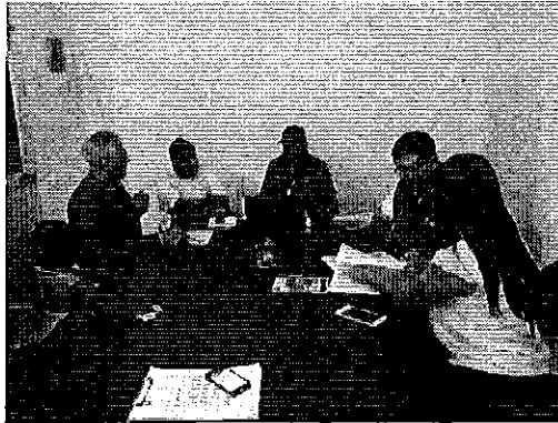
Ilustración 5. Reunión de trabajo en las oficinas de la EPMAPA-SD.