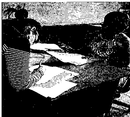
Foto: Llenado de ficha de avanzada