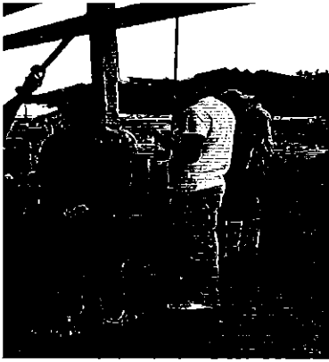
Foto: Entrega oficio a usuario en la provincia de El Oro