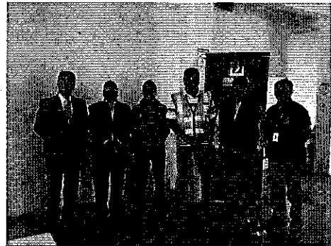
Fotografía 2. Funcionarios de la ARCA, SENAGUA-SAPyS y ARCSA, al término de la reunión.