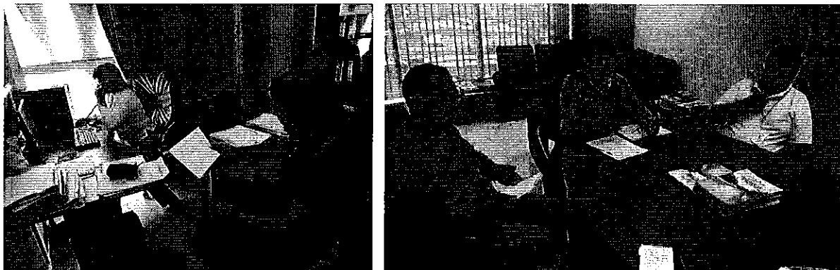
Fotografía 1. Reunión de trabajo en el CAC Machala y GAD Provincial, Dirección de Recursos Hídricos