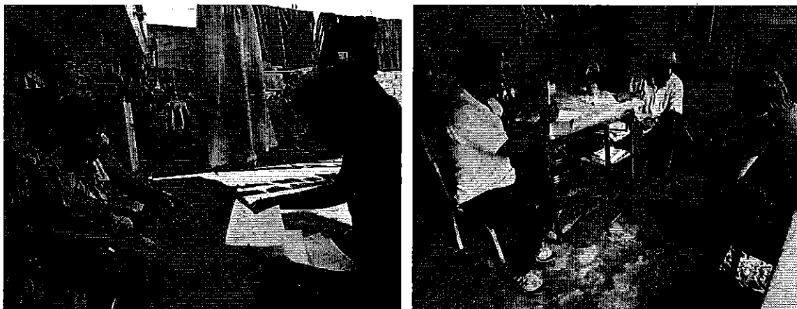
Fotografía 2. Reunión y entrega de oficios con los Directivos o representantes de las Juntas de Riego-provincia de El Oro