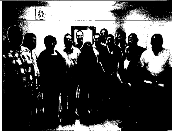
Ilustración 8. Equipo ARCA con el personal técnico y autoridades de la EMAARS-EP- y ARCSA.