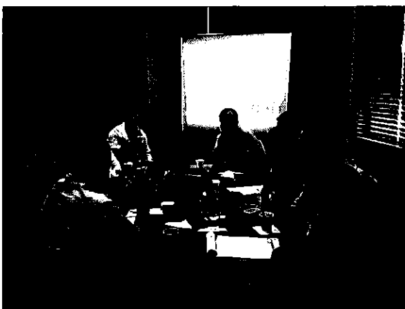
Imagen 5. Presentación del equipo ARCA en la Empresa de Aguas de Samborondón -AMAGUA