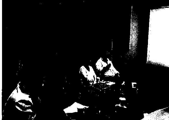
Imagen 6. Presentación del equipo ARCA con el personal técnico y autoridades de la Empresa de Aguas de Samborondón -AMAGUA y ARCSA.