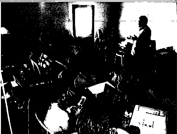
Imagen 7. Presentación del equipo ARCA en la EMAARS-EP