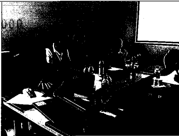
Imagen 3. Presentación del equipo ARCA en la Empresa de Agua y Alcantarillado de Machala EP