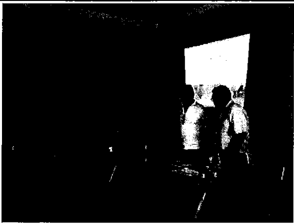
Imagen 9. Presentación del equipo ARCA en la Empresa de Agua Potable y Alcantarillado, San Mateo EAPA