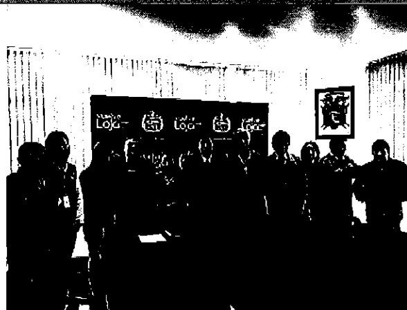
Imagen 1. Equipo ARCA con el personal técnico y autoridades del GAD de Loja y ARCSA