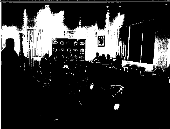
Imagen 1. Presentación del equipo ARCA en el GAD de Loja