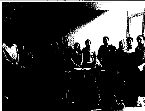
Imagen 4. Equipo ARCA con el personal técnico y autoridades de la Empresa de Agua y Alcantarillado de Machala EP y ARCSA.