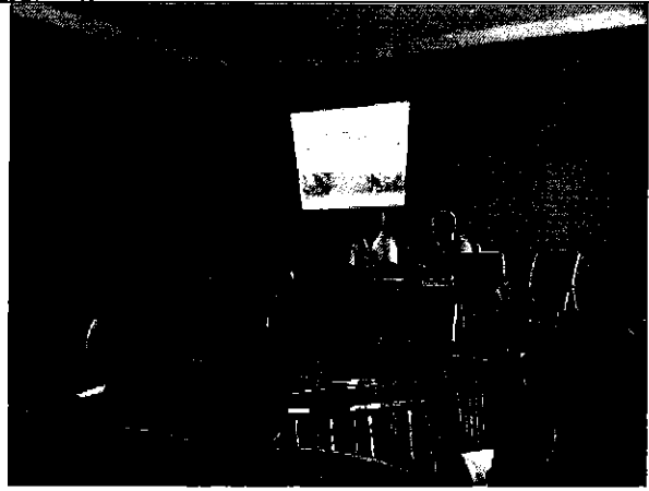
Imagen 10. Presentación del equipo ARCA con el personal técnico y autoridades de la EAPA y ARCSA.