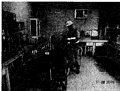
Ilustración 2. Laboratorio de la Planta de Tratamiento de Agua Potable de Chone.