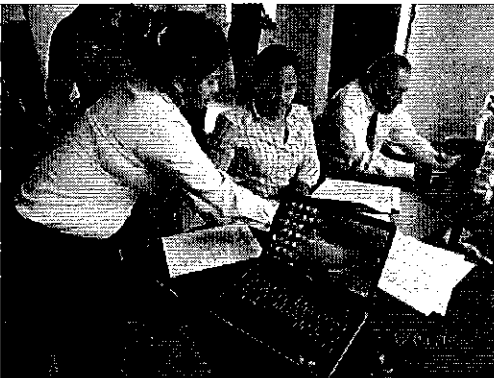
Ilustración 3. Reunión con los funcionarios del GAD Municipal de Chone y de la EP.