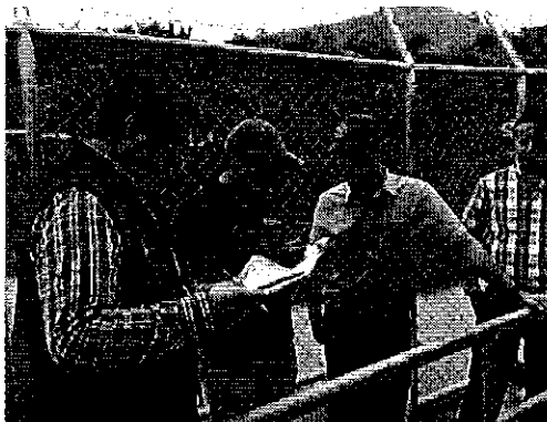
Ilustración 1. Captación margen izquierda del río Chone.