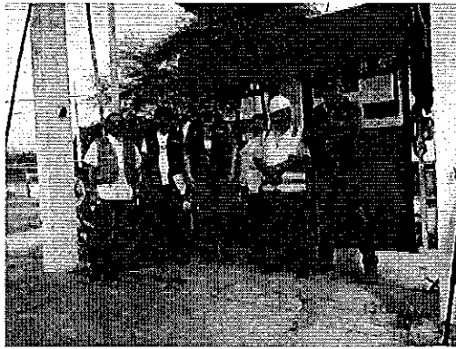
Ilustración 5. Captación que se realiza en la fuente superficial canal de margen derecho del Sistema de Riego Poza Honda (Portoviejo).