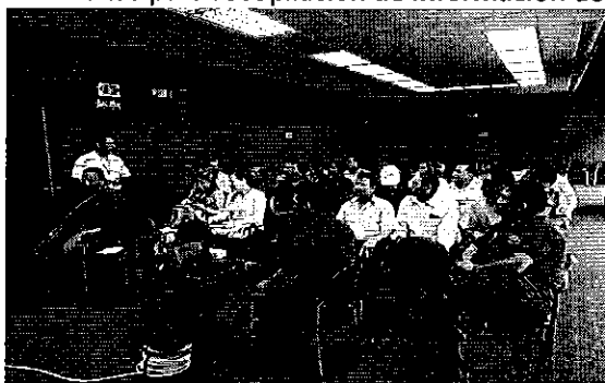
Fotografía 1. Reunión con los representantes de los Directorios de Aguas de la Provincia de El Oro.