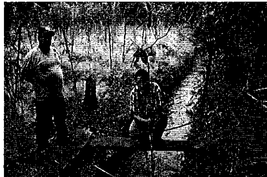
Profesionales de la ARCA en Reunión con los representantes del Directorio de Aguas Nueva Unión 6 de Julio y medición de caudal.