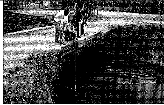
Profesionales de la ARCA en reunión con representantes Junta General Usuarios del Sistema de Riego Mariscal Sucre y medición de caudales.

16:30 - 17:00 Retorno desde Mariscal Sucre a la ciudad de Milagro