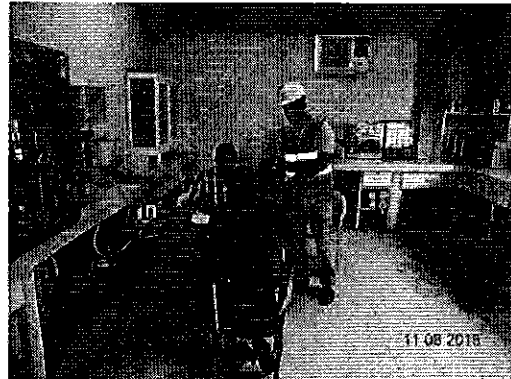
Ilustración 2. Laboratorio de la Planta de Tratamiento de Agua Potable de Chone.