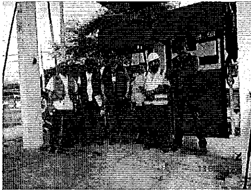
Ilustración 5. Captación que se realiza en la fuente superficial canal de margen derecho del Sistema de Riego Poza Honda (Portoviejo).