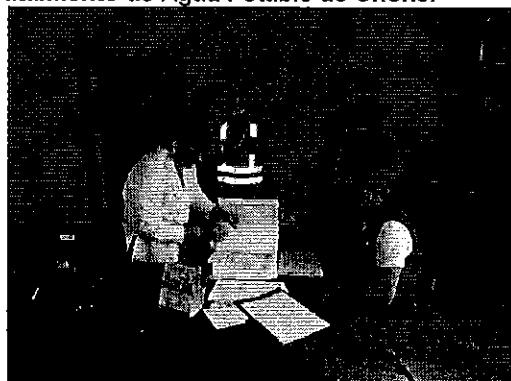
Ilustración 4. Laboratorio de la Planta de Agua Potable de la EPMAPAP de Portoviejo.