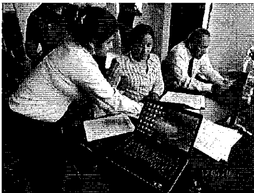
Ilustración 3. Reunión con los funcionarios del GAD Municipal de Chone y de la EP.