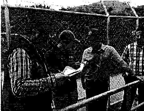
Ilustración 1. Captación margen izquierda del río Chone.