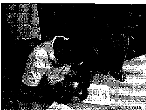
Ilustración 6. Firma del acta de compromisos del Director de Obras Públicas del GAD Municipal de Puerto Quito.