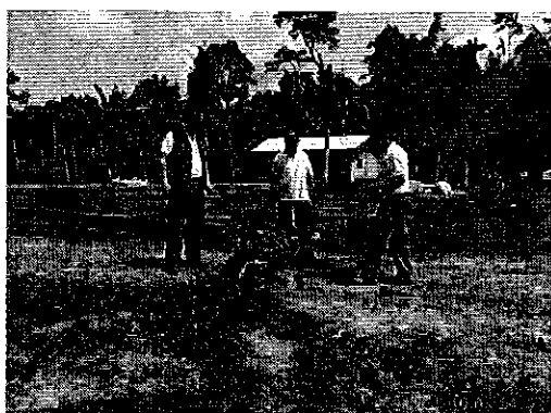
Ilustración 4. Visita técnica al sistema de distribución de agua potable, Recinto Grupo Mielles del cantón Puerto Quito.