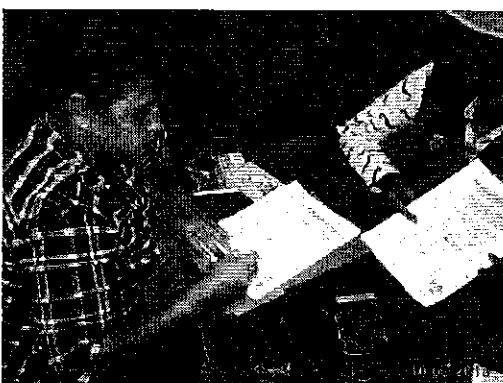
Ilustración 5. Firma del acta de compromisos de la Delegada por todos los recintos de las JAAP en el Recinto San Antonio de la Abundancia de Puerto Quito.