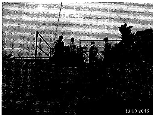
Ilustración 1. Inspección de las instalaciones de la Planta de Tratamiento de Agua Potable en el Recinto Los Laureles del cantón Puerto Quito.