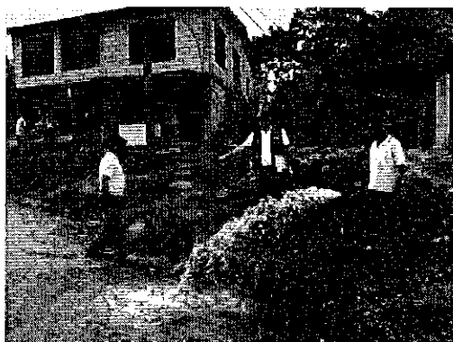
Ilustración 3. Visita técnica al sistema de distribución de agua potable, Recinto Las Palmas del cantón Puerto Quito.