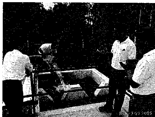
Ilustración 2. Aforo volumétrico de caudal de ingreso a la Planta de Tratamiento de Agua Potable en el Recinto Los Laureles del cantón Puerto Quito.