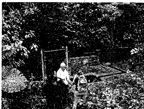
Ilustración 2. Visita técnica al effluente de captación río Zapanal, Recinto La Envidia del cantón Pangua.