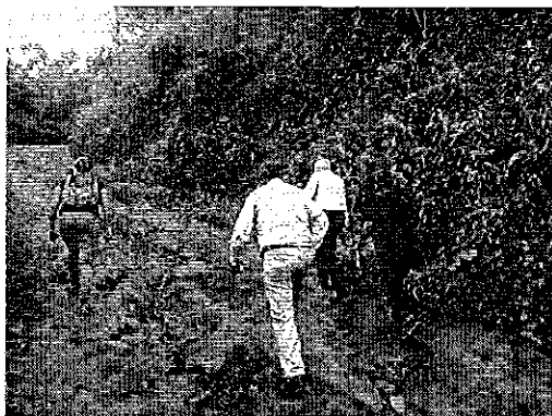
Ilustración 1. Inspección de las instalaciones de captación en el Recinto La Envidia del cantón Pangua.