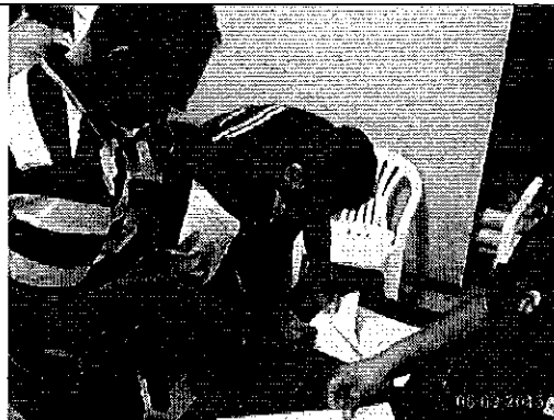
Ilustración 5. Firma del acta de compromisos del responsable de la SENAGUA, oficinas de la JAAP.