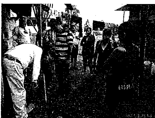
Ilustración 4. Instalaciones de agua, Recinto La Esperanza del cantón La Maná.