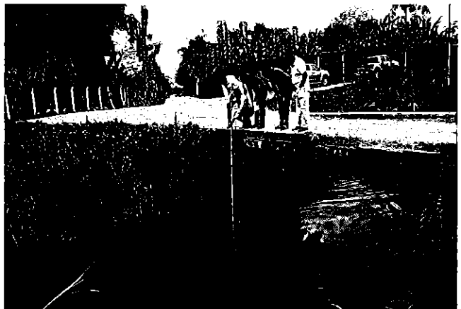
Profesionales del ARCA en la Inspección; junto a los representantes de la Junta General de Usuarios del SRD Milagro y medición de caudal.