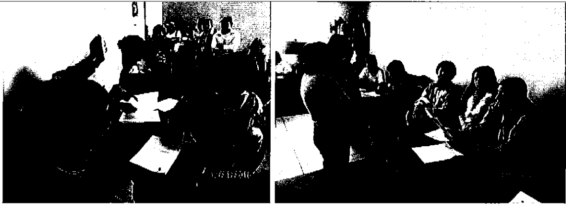
Profesionales de la ARCA participando en la reunión y entrega de información solicitada