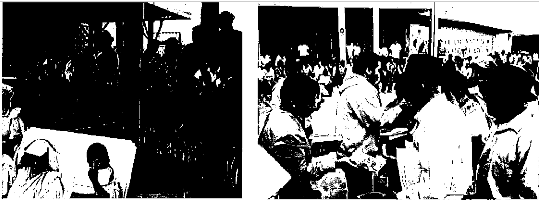
Profesionales ARCA socializando la LORHUyA a consumidores y representantes de Instituciones.