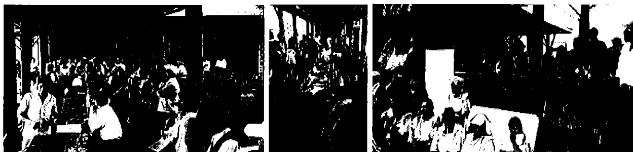
Profesionales ARCA participando en la Asamblea General Extraordinaria de la Junta de Riego Imantag.