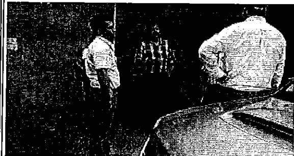
Inspección obras de Interagua