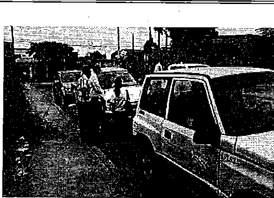
Inspección obras de Interagua