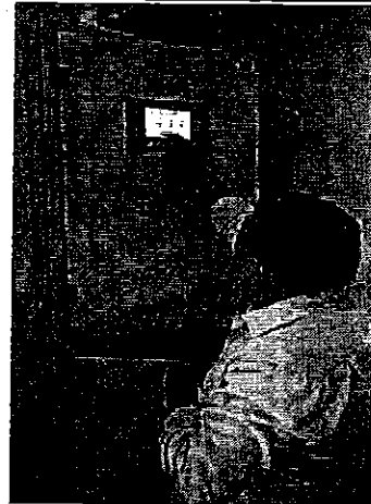
Inspección sistema de agua potable