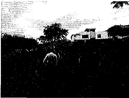
Reunión de trabajo con los señores representantes de GAD Imbabura