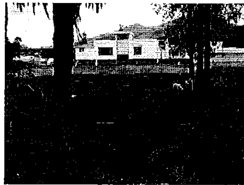
Obras de captación ubicadas en el complejo Yuyucocha