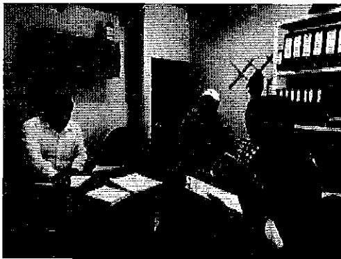
Reunión de trabajo con los señores representantes de GAD Imbabura