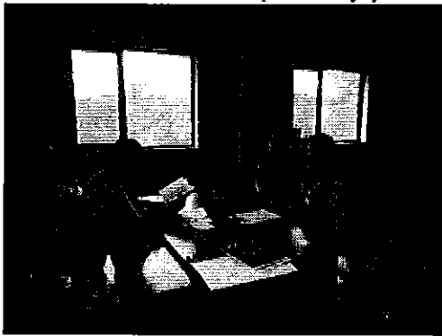
Reunión de trabajo con el señor Eliecer Chauca, mayordomo de la Hacienda "Palenque - Pitajaya"