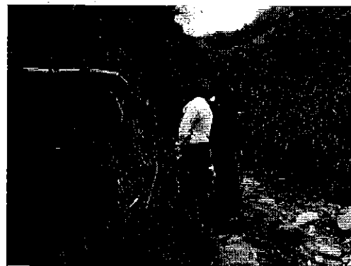
Inspección técnica en el balneario Chachimbiro