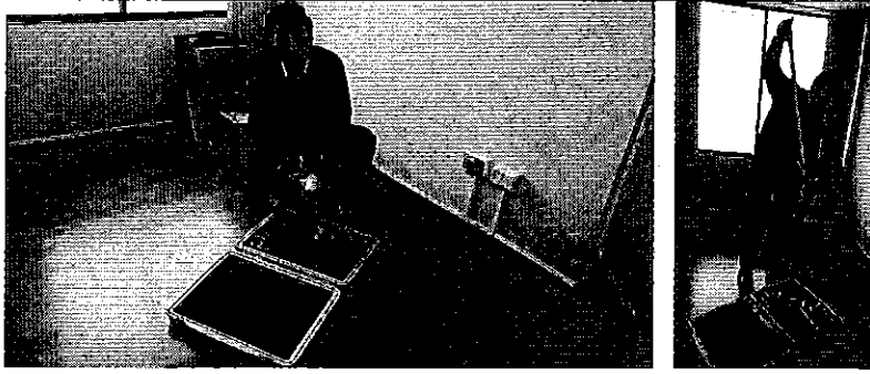
Fotografía 1. Inspección y prueba del mollinete F2642.