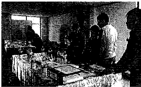
Ilustración 1: Lectura de Acta de JAAP, Colaisa