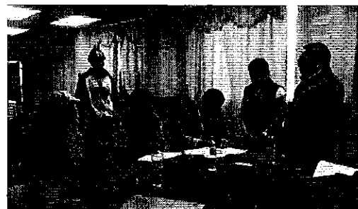
Ilustración 5: Firma de Acta, en JAAP Yanahurco