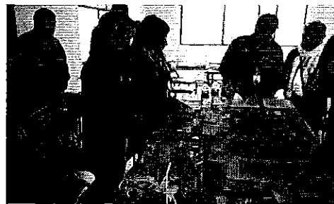
Ilustración 2: Firma de Acta, JAAP - Colaisa