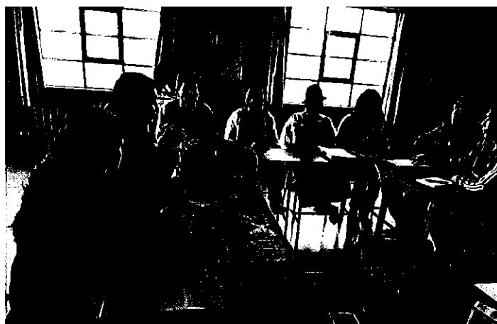
Participantes en la Mesa Técnica Imantag.