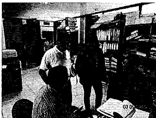
Ilustración 1. Reunión en el GAD Municipal de Puerto Quito para solicitar información.