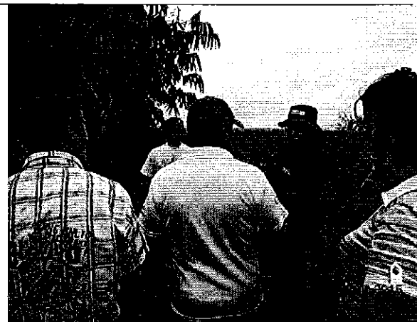
Ilustración 4. Reunión Integrantes de la JAAP de Puerto Rico.