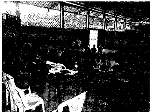
Ilustración 6. Reunión de trabajo en el Coliseo Luis Felipe López, Recinto Puerto Rico.