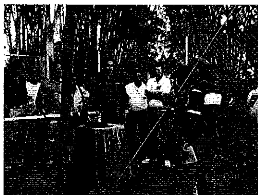
Ilustración 2. Visita técnica al pozo profundo de captación, Recinto Puerto Rico.