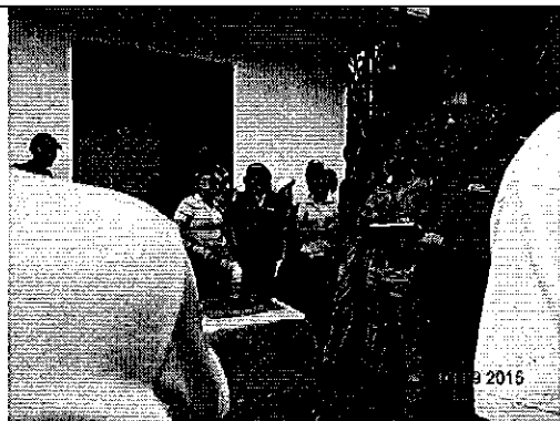
Ilustración 3. Visita técnica al pozo profundo de captación, Recinto Puerto Rico.