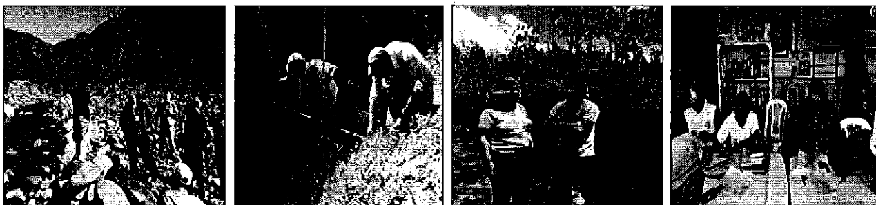
Fotografía 3. Recorrido a la zona de captación, aforo y entrevistas a los consumidores del Directorio de Aguas del Canal de Riego Pucallpa.