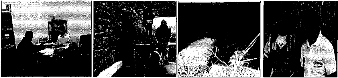
Fotografía 1. Reunión de trabajo con representantes, recorrido a la zona de captación y aforo del Directorio del Sistema de Aguas San Francisco.