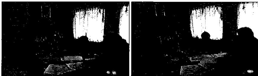
Fotografía 2. Reunión de trabajo con representantes del Directorio de Aguas del Canal de Riego Gualaceo – San Juan.