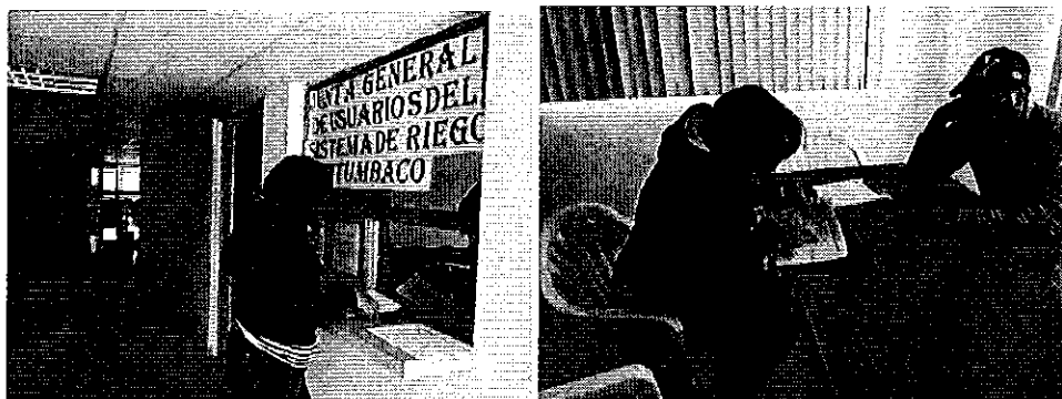
Fotografía 3. Entrega de invitaciones a la reunión de trabajo.