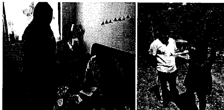
Fotografía 2. Entrega de invitaciones a la reunión de trabajo.