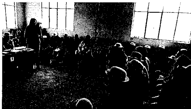
Fotografía 1. Reunión con miembros y consumidores del Canal de Riego Chuichun.