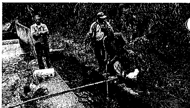
Fotografía 2. Visita, recorrido, aforamiento en el Sistema de Riego El Tablón.