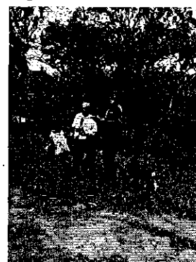
Fotografía 3. Visita, recorrido y aforo a la infraestructura de riego del Directorio de Aguas del Río Burro.