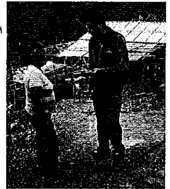
Fotografía 4. Visita, recorrido, aforamiento el Directorio de Aguas del Jabashuaico.