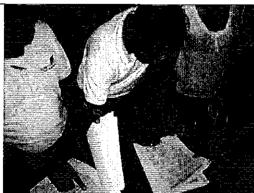
Ilustración 6. Firma del acta de compromisos con todos los miembros de las Juntas y funcionarios del GAD, en la Casa Comuna de San Antonio de la Abundancia de Puerto Quito.