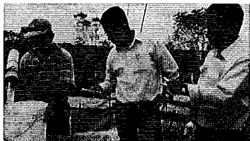
Ilustración 3. Aforo volumétrico de la captación de la JAAP San Antonio de la Abundancia del cantón Puerto Quito.