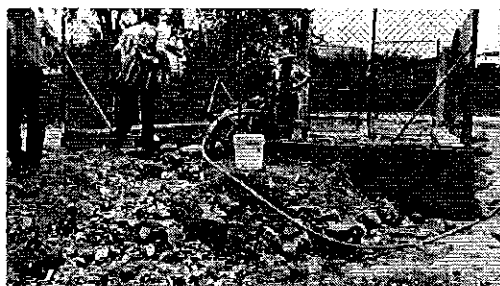
Ilustración 4. Pozo nuevo del proyecto del GAD en el recinto San Antonio de la Abundancia del cantón Puerto Quito.