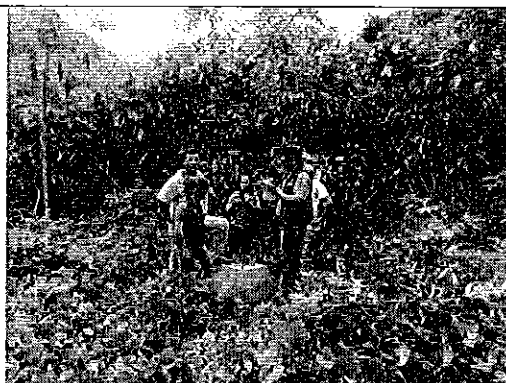
Ilustración 5. Pozo de captación de agua subterránea en el recinto Santa Teresita de Puerto Quito.