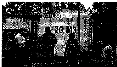
Ilustración 2. Visita de campo a la planta de tratamiento de la JAAP San Antonio de la Abundancia del cantón Puerto Quito.