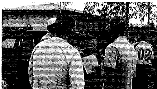
Ilustración 1. Reunión con los miembros de la JAAP San Antonio de la Abundancia del cantón Puerto Quito.