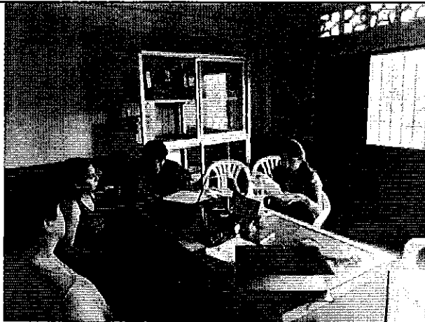
Imagen 1. Revisión de la información disponible por la JAAP La Abundancia.