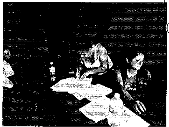
Imagen 4. PActividades de oficina con los representantes de las JAAP La Abundancia.