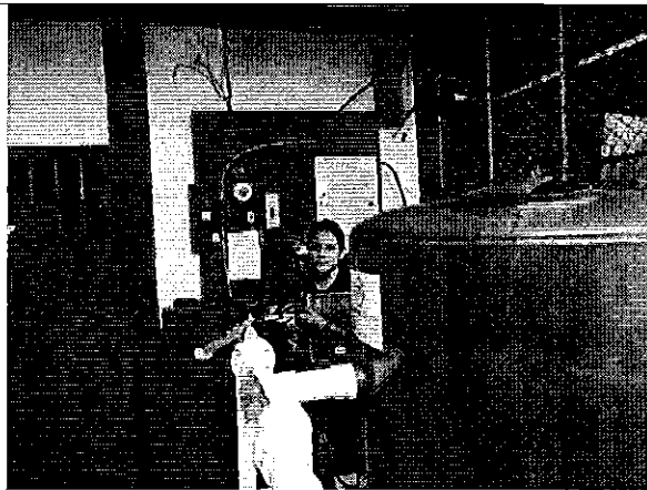
Imagen 3. Inspección de la planta de tratamiento de la JAAP del recinto La Abundancia.