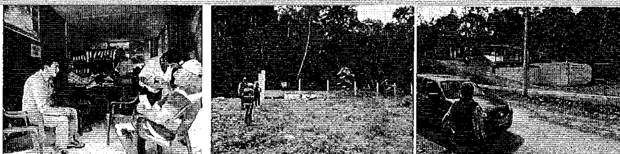
Ilustración 1: Diálogo con representantes a la JAAP de Alluriquin, inspección a la captación y planta de tratamiento.