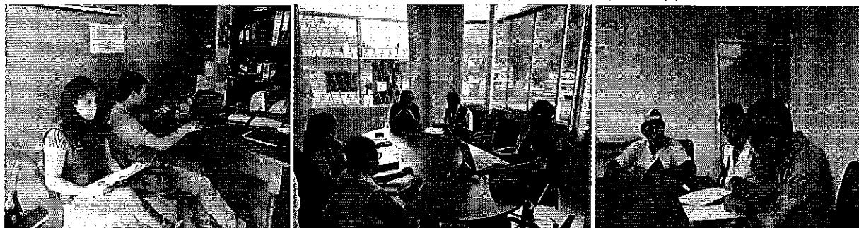
Ilustración 2: ingreso de datos reportados por la JAAP, reunión en el GAD parroquial y firmas de actas de compromisos y planes de trabajo.