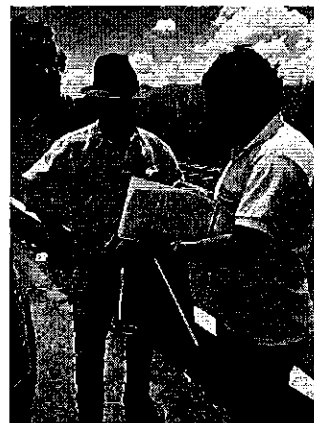
Fotografía 3. Participantes en la reunión de trabajo con las JRC de la provincia de Cotopaxi