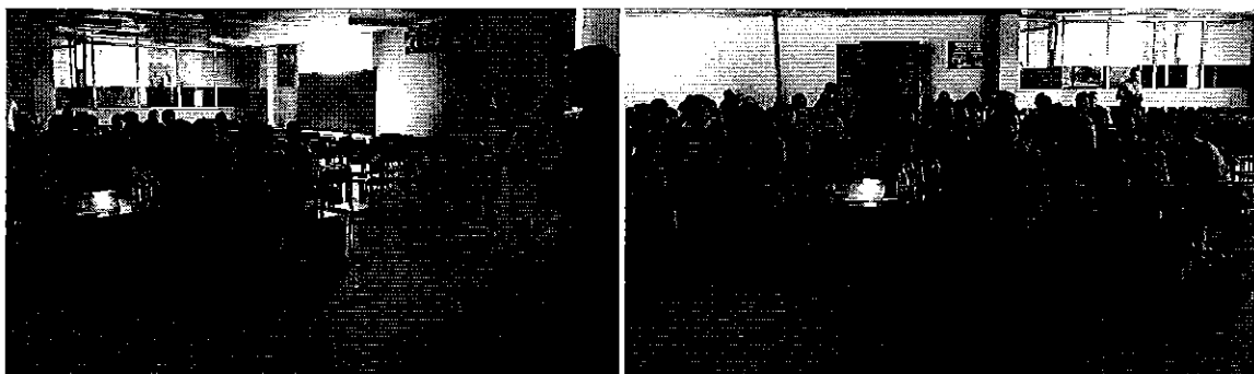
Fotografía 4. Participantes en la reunión de trabajo con las JRC de la provincia de Tungurahua