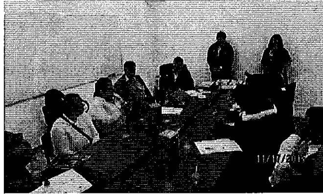
Fotografía 1. Participantes en la reunión de trabajo con las JRC de la provincia de Carchi