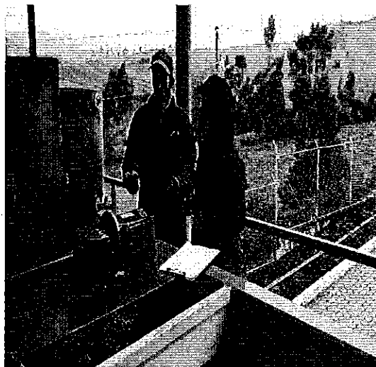
Ilustración 2. Inspección tanque de abastecimiento, de la Junta Administradora de Agua Potable y alcantarillado Regional Yanahurco Cantón Mocha.