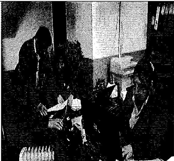
Ilustración 3. Recopilación y sistematización de información, de la Junta Administradora de Agua Potable y alcantarillado Regional Yanahurco Cantón Mocha.