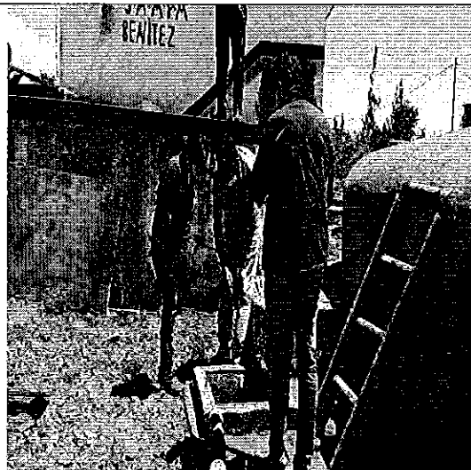
Ilustración 4. Inspección tanques de reserva y desinfección mediante clorogás, de la Junta Administradora de Agua Potable y alcantarillado Benítez Cantón Pellileo.