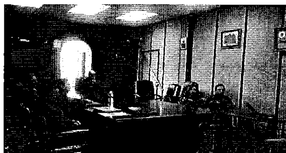
Ilustración 8 Equipo ARCA con el personal técnico y autoridades del cantón Pelileo