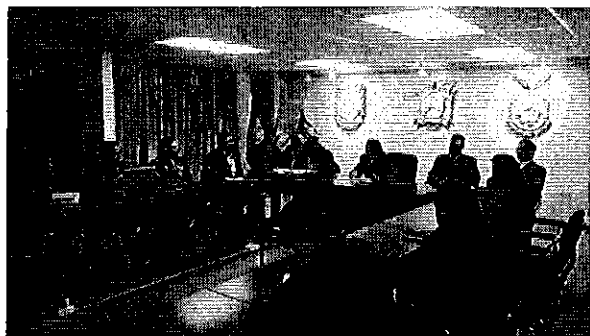
Ilustración 5 Presentación de resultados en el Cantón Tisaleo