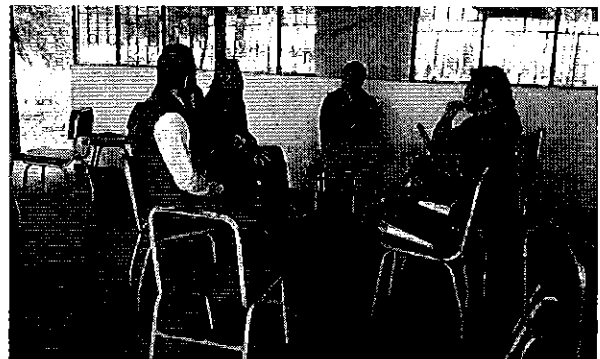
Ilustración 2 Equipo ARCA en Latacunga