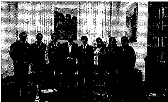
Ilustración 3 Equipo ARCA en Ambato