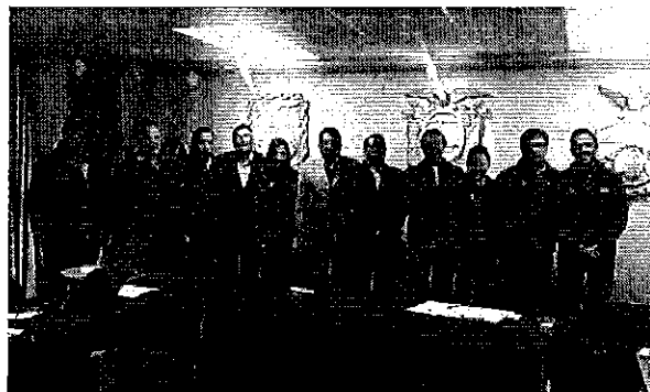
Ilustración 6 Equipo ARCA con el personal técnico y autoridades del cantón Tisaleo