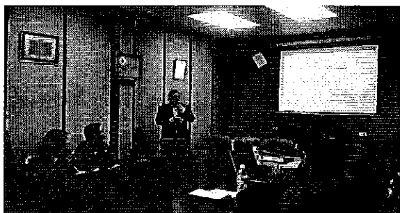
Ilustración 7 Presentación de resultados en el Cantón Pelileo