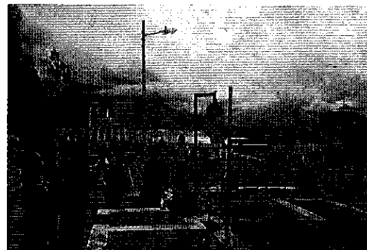
Ilustración 4. Visita a la Planta de Tratamiento de Agua Potable en Ambato