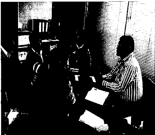
Ilustración 3. Equipo ARCA con el personal técnico de la Dirección de Operación y Mantenimiento