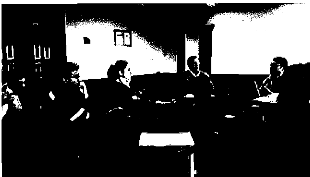
Ilustración 1. Reunión con los responsables de las áreas a controlar