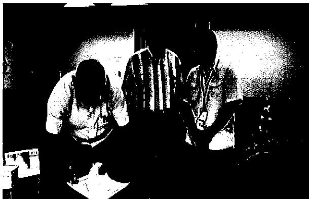
Ilustración 7 Equipo ARCA durante la firma del acta con los representantes de las áreas controladas