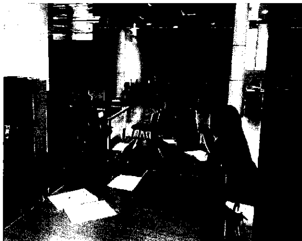
Ilustración 5. Equipo ARCA con el personal técnico de la Dirección de Comercialización.