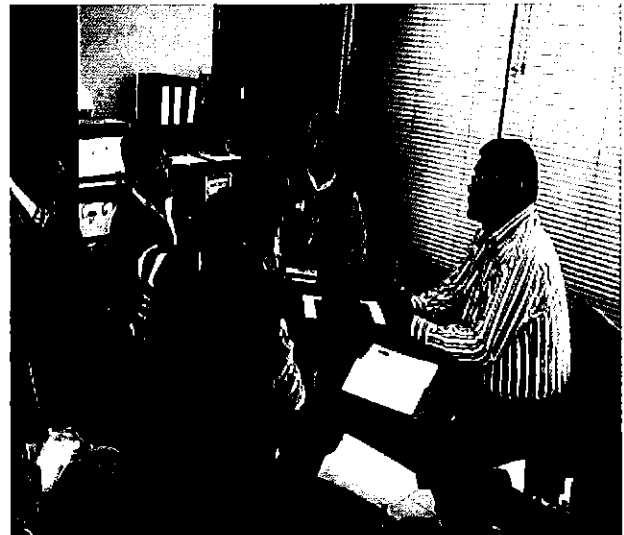
Ilustración 4. Equipo ARCA con el personal técnico de la Dirección de Gestión de Proyectos e Infraestructura