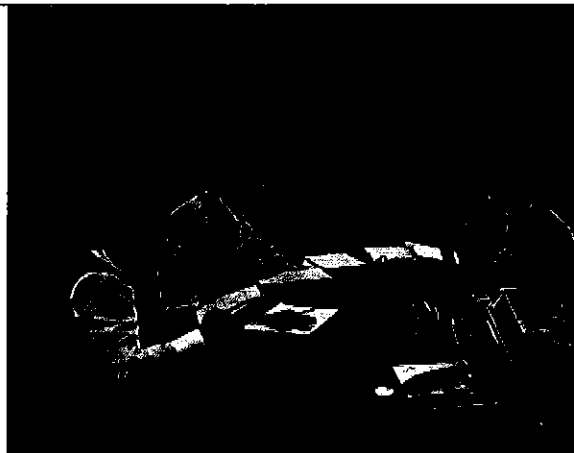
Ilustración 8 Equipo ARCA con el personal de la Dirección Administrativa