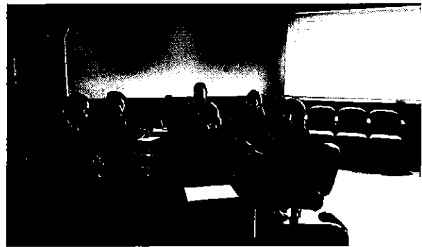
Ilustración 2. Equipo ARCA con el personal técnico responsable de las áreas a controlar