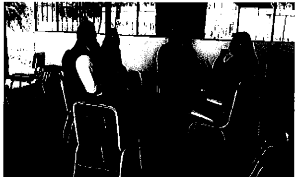
Ilustración 2 Equipo ARCA en Latacunga