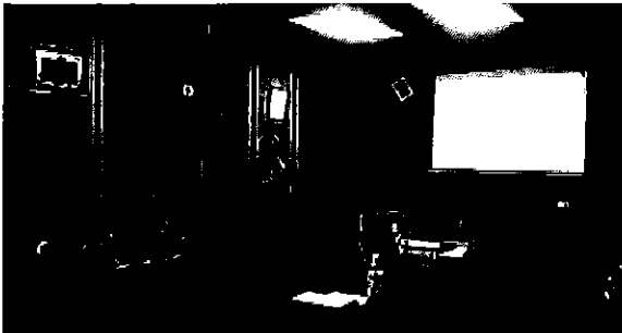
Ilustración 7 Presentación de resultados en el Cantón Pelileo