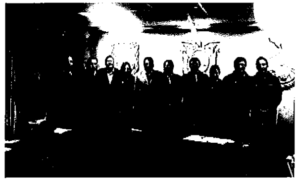
Ilustración 6 Equipo ARCA con el personal técnico y autoridades del cantón Tisaleo