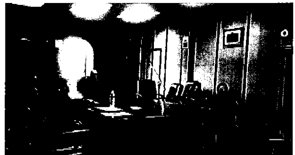
Ilustración 8 Equipo ARCA con el personal técnico y autoridades del cantón Pelileo