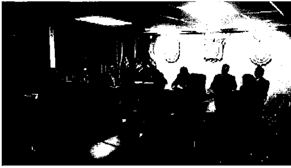
Ilustración 5 Presentación de resultados en el Cantón Tisaleo