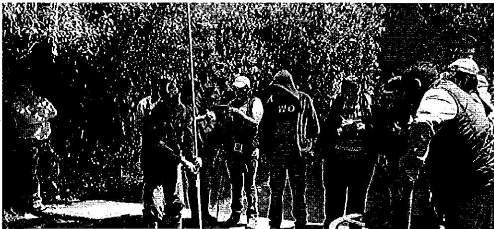
Fotografía 3. Prácticas de aforos.