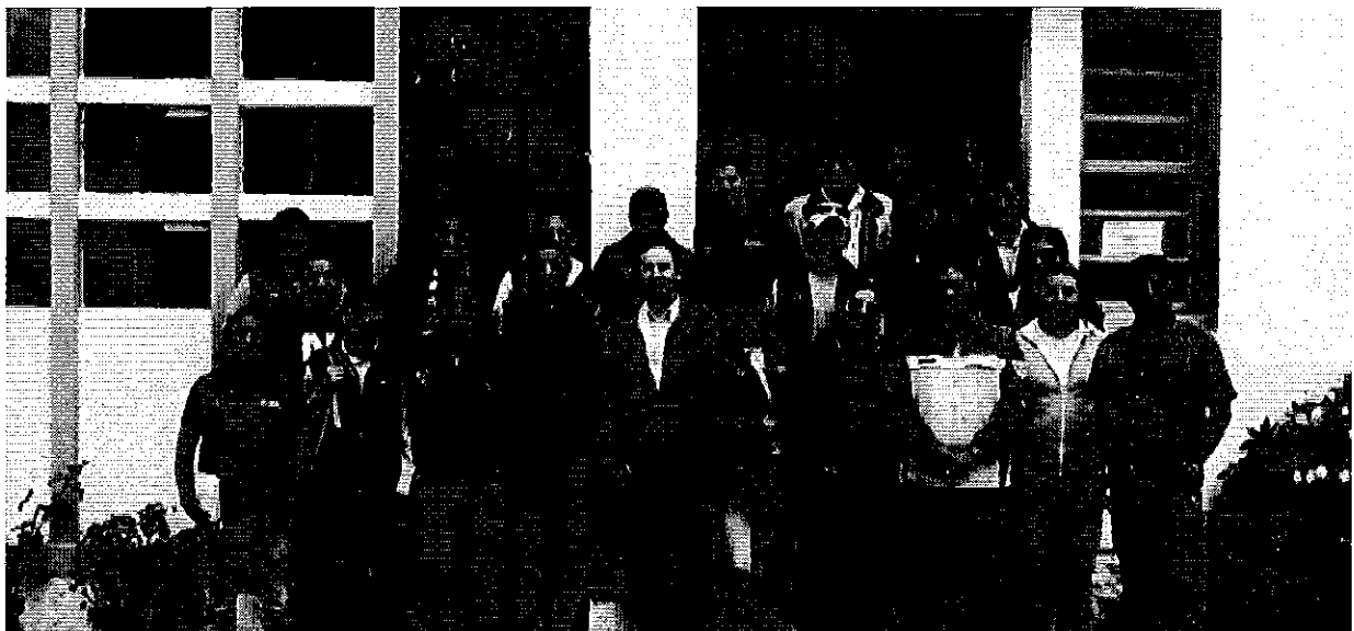
Fotografía 1. Dirigentes del sistema de riego El Pisque, Facilitadores de taller (INAMHI), funcionarios de SENAGUA y Profesionales de la ARCA.