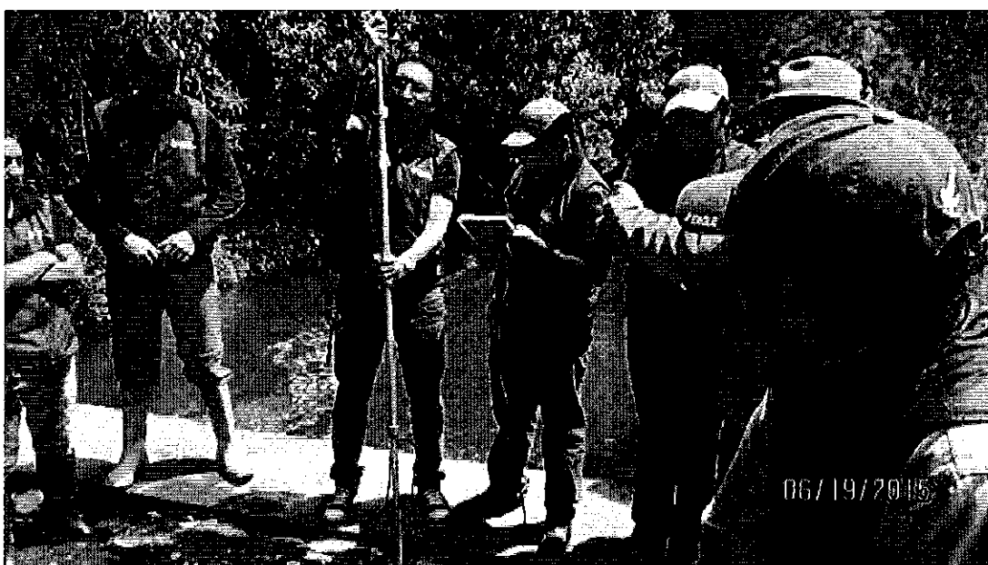
Fotografía 3. Prácticas de aforos.