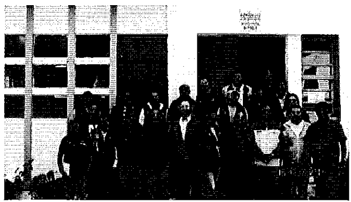
Fotografía 1. Dirigentes del sistema de riego El Pisque, Facilitadores de taller (INAMHI), funcionarios de SENAGUA y Profesionales de la ARCA.