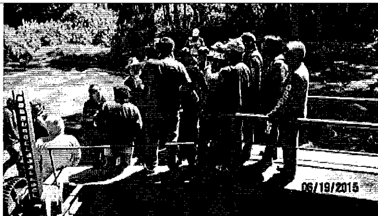
Fotografía 2. Recorrido por la Infraestructura de captación del sistema El Pisque.