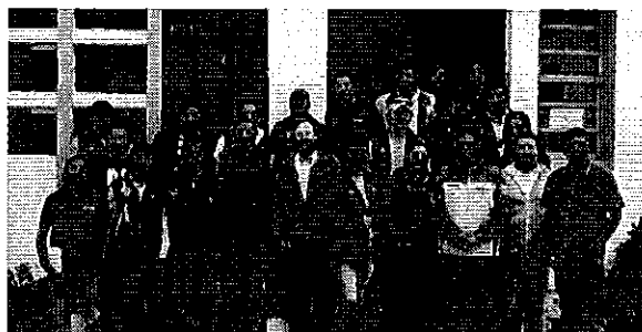
Fotografía 1. Dirigentes del sistema de riego El Pisque, Facilitadores de taller (INAMHI), funcionarios de SENAGUA y Profesionales de la ARCA.