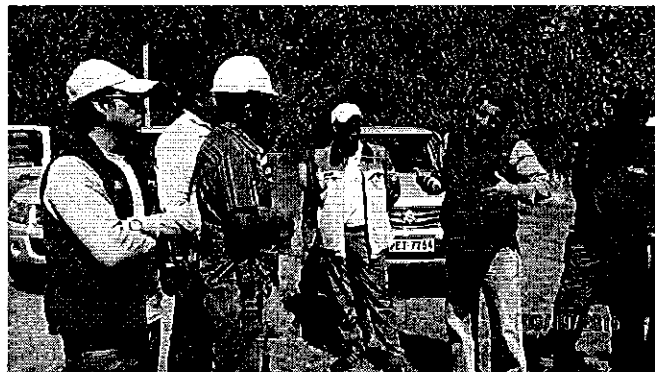
Fotografía 1. Explicación de Indicaciones antes del aforo.