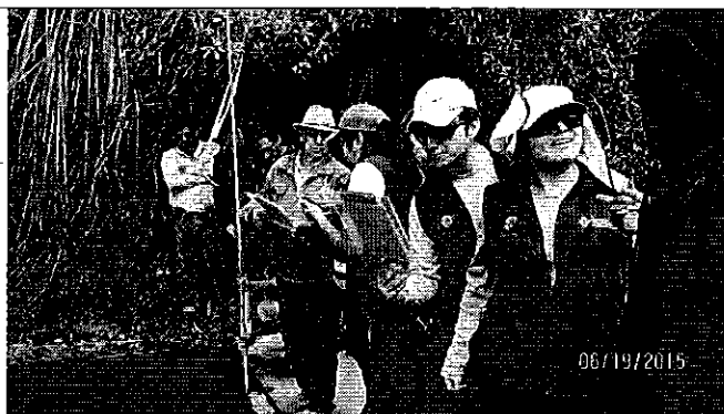
Fotografía 2.Revisión de los cálculos del aforo.