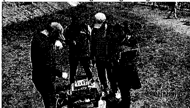
Fotografía 3. Explicación de toma de muestras de calidad de agua.