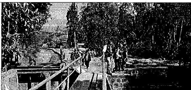
Fotografía 2. Recorrido por la infraestructura de captación del sistema El Pisque.