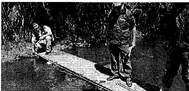
Fotografía 3. Prácticas de aforos.