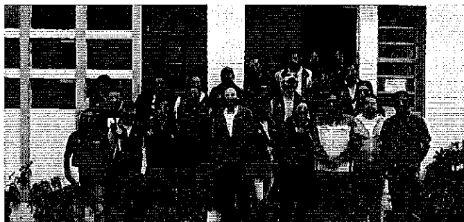
Fotografía 1. Dirigentes del sistema de riego El Pisque, Facilitadores de taller (INAMHI), funcionarios de SENAGUA y Profesionales de la ARCA.