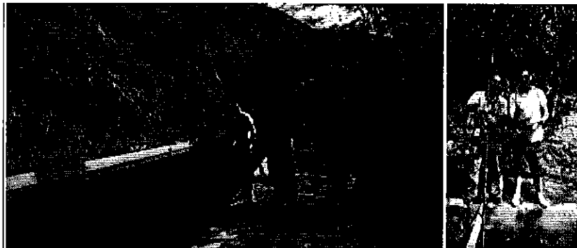
Fotografía 5. Aforo en la captación del sistema La Internacional.