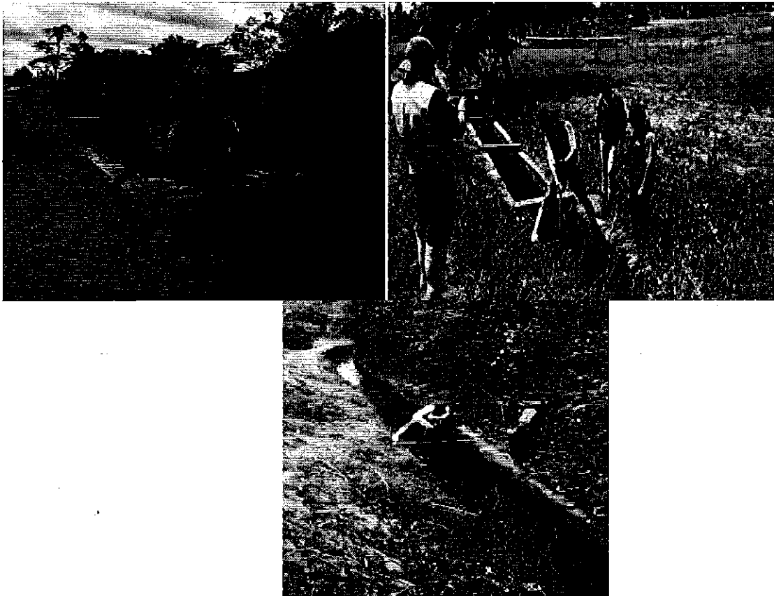
Fotografía 3. Aforo de caudales en la Captación, Conducción y antes del 1er Ramal