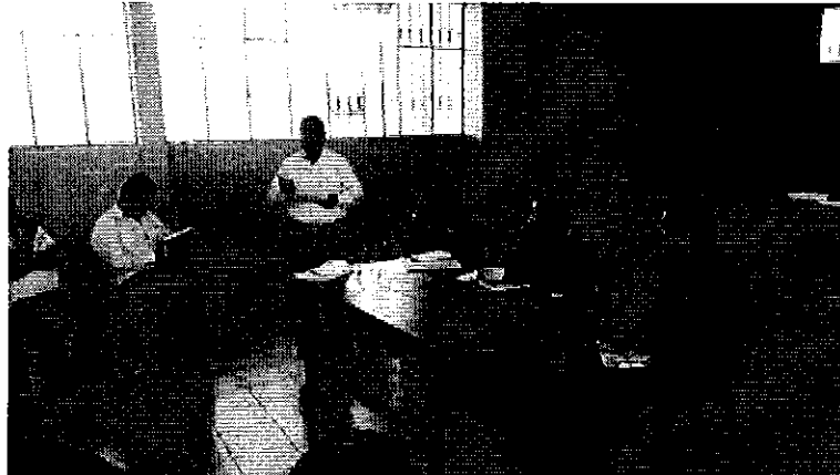
Fotografía 7. Dirigentes del sistema de riego Peguche y Profesionales de la ARCA.