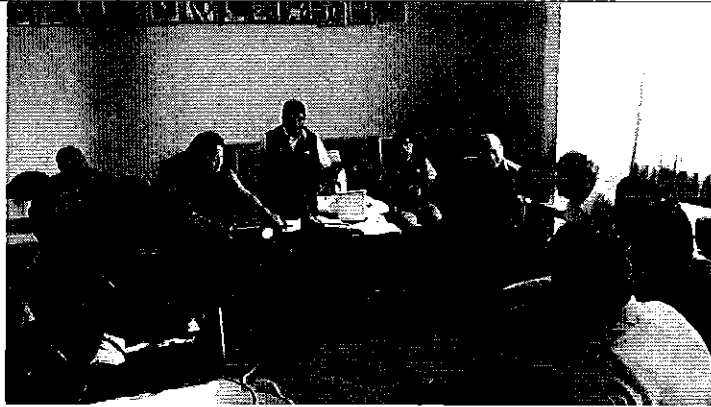
Fotografía 4. Dirigentes del sistema de riego La Internacional y Profesionales de la ARCA.