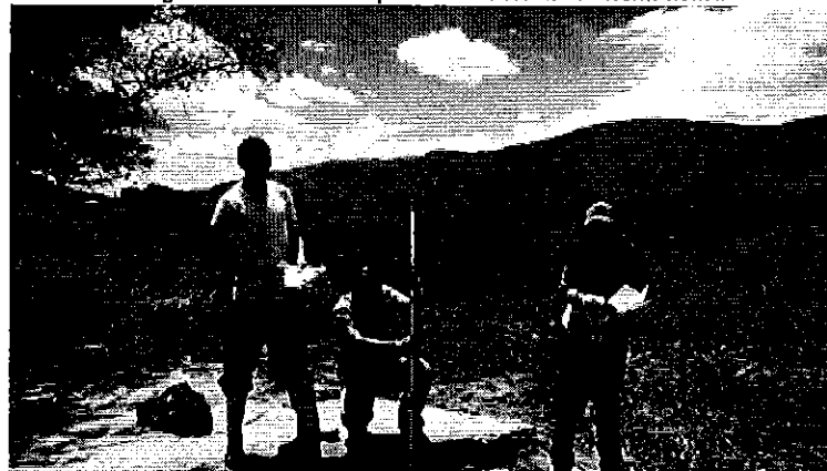
Fotografía 6. Aforo en el canal de conducción del sistema La Internacional.