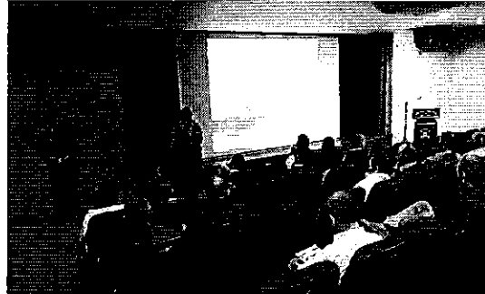
Fotografía 1. Representantes de las Juntas de riego Comunitarias participantes en la reunión de trabajo, Ibarra - Imbabura