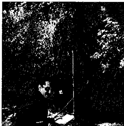
Fotografía 8. Aforo de caudales en la Captación, Conducción y antes del 1er Ramal