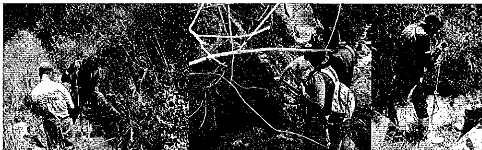
Fotografía 5. Visita, recorrido, aforamiento a la Acequia Monte Olivo San Rafael