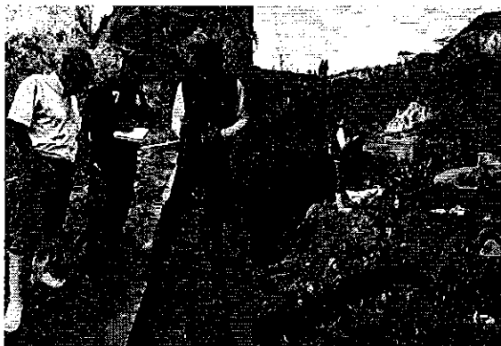
Fotografía 2. Visita, recorrido, aforamiento a la Acequia El Taladro