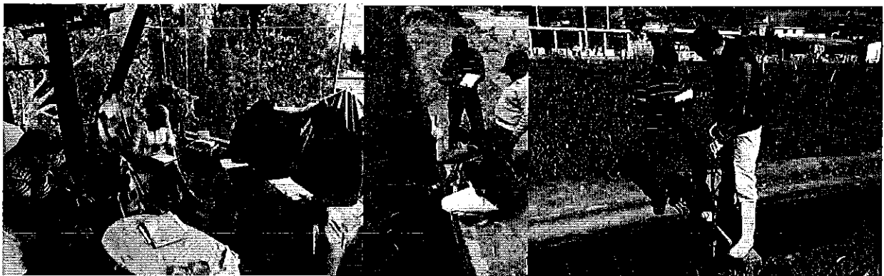
Fotografía 1. Visita, recorrido, aforamiento a la Acequia Quinchuqui Alto.