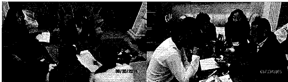
Fotografía 4. Entrega y Capacitación de GPS