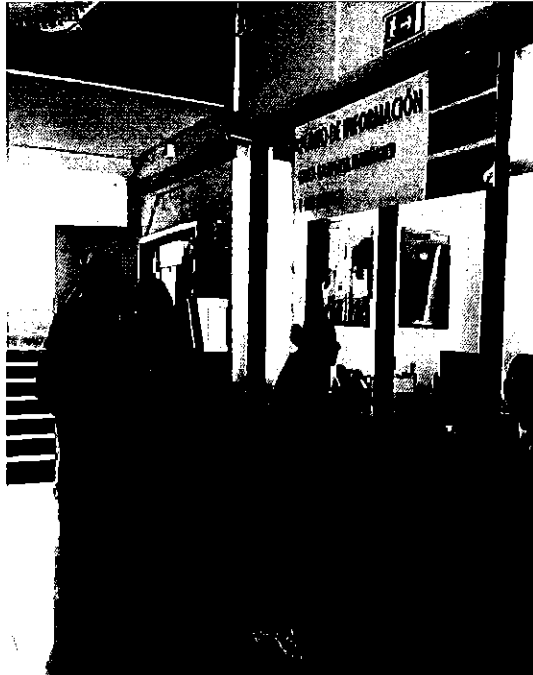
Fotografía 1. Información en el Municipio de Rumiñahui.