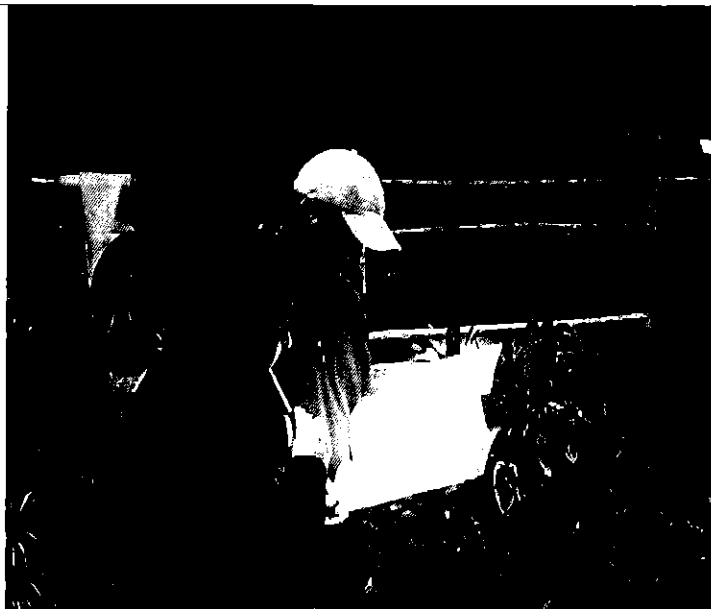
Fotografía 3. Información relevante piscícolas.