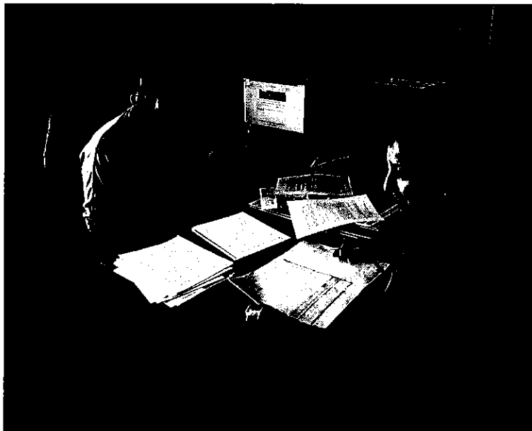
Fotografía 2. Junta Parroquial de Pintag, información sobre localización de usuario.